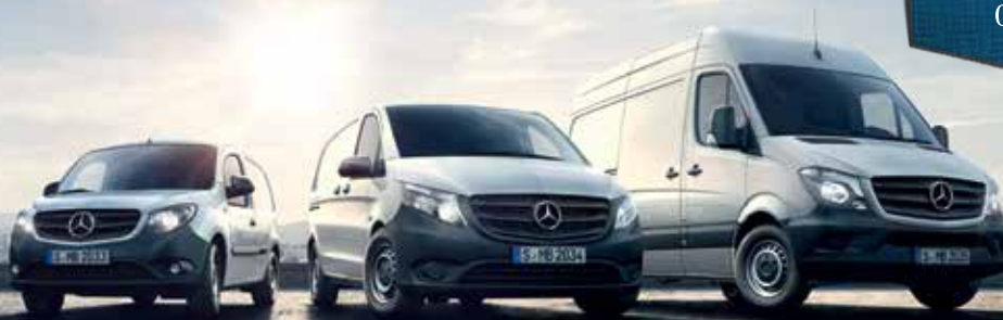
Abbildung enthält Sonderausstattung.